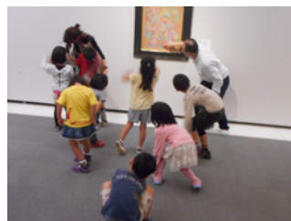
線や形や色を身体で表現しているよ