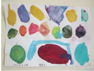
色の名前は「にここいろ」