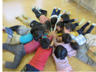
いろをみんなで表現したよ