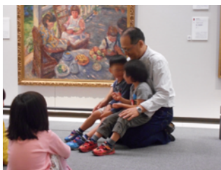
絵のなかの男の子になってみる

「どんないろがすき？」「その色は、どんな名前かな？」「キラキラ色」「あったかい色」「どこどこ色」。子どもたちはいろんな思いをイメージして自分の色をつくり名前を付けました。自分たちの色ができると「○○ちゃんの色ってどんな色？」「こんな色」とみんなに見せながら「□□色♪」と発表します。そして、ウッドブロックに合わせて、友達と手を繋いでみたり、集まってみたり、一人で表現してみたりして子どもたちがその時々思い付いた自由な表現を楽しみました。