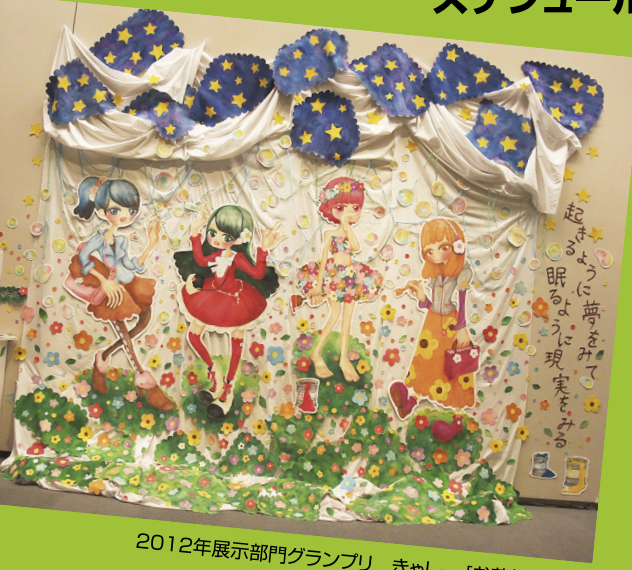
2012年展示部門グランプリ きゃしー【お花畑ガール】