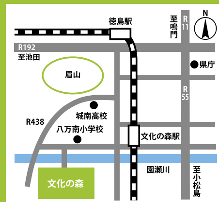
グリーン購入法適合製品を使用しています。

様々な表現活動を行っている人や、あこがれを持っている人たちに、ひろく活動発表の場を提供し、未来へ羽ばたく徳島発のアーティストを発見・支援しようという事業です。文化の森の徳島県立近代美術館と徳島県立二十一世紀館が会場です。絵画、彫刻、工芸、陶芸、書道、染織、写真、版画等の「展示部門」と、音楽、ダンス、朗読、芸能等の「パフォーマンス部門」の2部門で、徳島県出身者または県内在住者を対象に、参加者を募集します。それぞれの部門ごとに複数の審査員による審査を行い、グランプリほか各賞を決定します。そして受賞者の発表会も開催します。栄冠は誰の手に!?みなさんのチャレンジをお待ちしています。