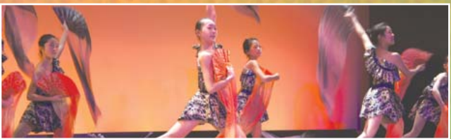
平成25年度 パフォーマンス部門 【グランプリ】パトンプレイス徳島(ダンス) 【準グランプリ】M&G(マンドリンとギターの演奏) 【チャレンジ奨励賞】徳島はっちー(大道芸) Pendre(スティールパン演奏) 【MIP賞】ヌック ヌック(オカリナ演奏)