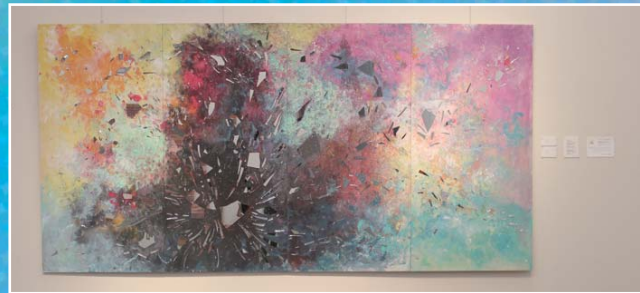
平成27年度 展示部門 【グランプリ】はなのようこ(絵画インスタレーション) 【準グランプリ】ハラダサキ(細密画) 【チャレンジ奨励賞】穴山 千代子(手織)、まるおかあきこ(ミクストメディア) 杉本 悠希(絵画) 【MIP賞】永田広志(絵画)