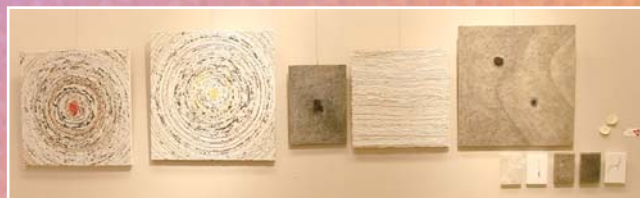
平成25年度 展示部門 【グランプリ】尾田稔子(絵画と造形) 【準グランプリ】タニザキ ヒロエ(絵画) 【チャレンジ奨励賞】安慶田 渉(彫刻)、伊丹直子(絵画) 宗谷茜(映像インスタレーション) 【MIP賞】和布遊び仲間となり(工芸)