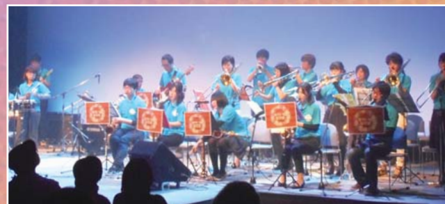
平成26年度 パフォーマンス部門 【グランプリ】たけと愉快的仲間たち(ビッグバンドジャズ) 【準グランプリ】徳島はっちー(クラウン[道化師]) 【チャレンジ奨励賞】徳島市立高校ダンス部(ダンス)、カーネーション(オカリナグループ) 【MIP賞】ラッキークローバー(創作ダンス)