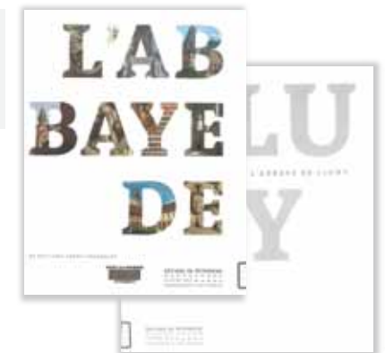
フランス クリュニー修道院についての本