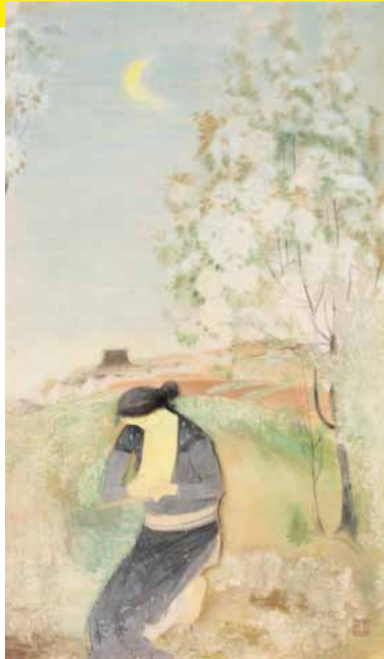
〈夕暮れの春〉一九二〇年 徳島県立近代美術館蔵