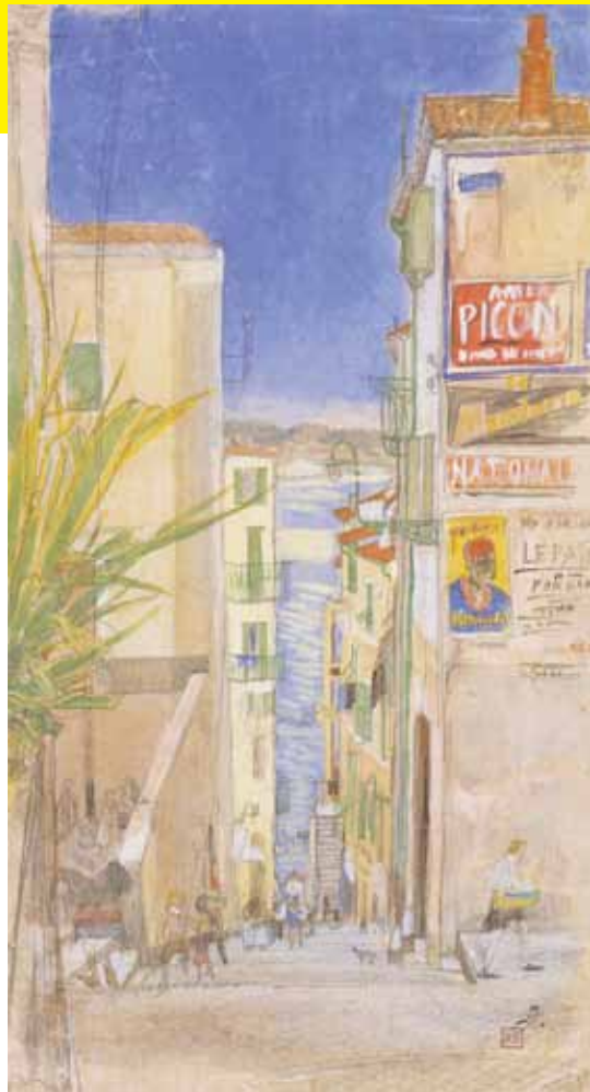
〈ピール・フランシュ 南欧の海邊〉 1932年 徳島県立近代美術館蔵